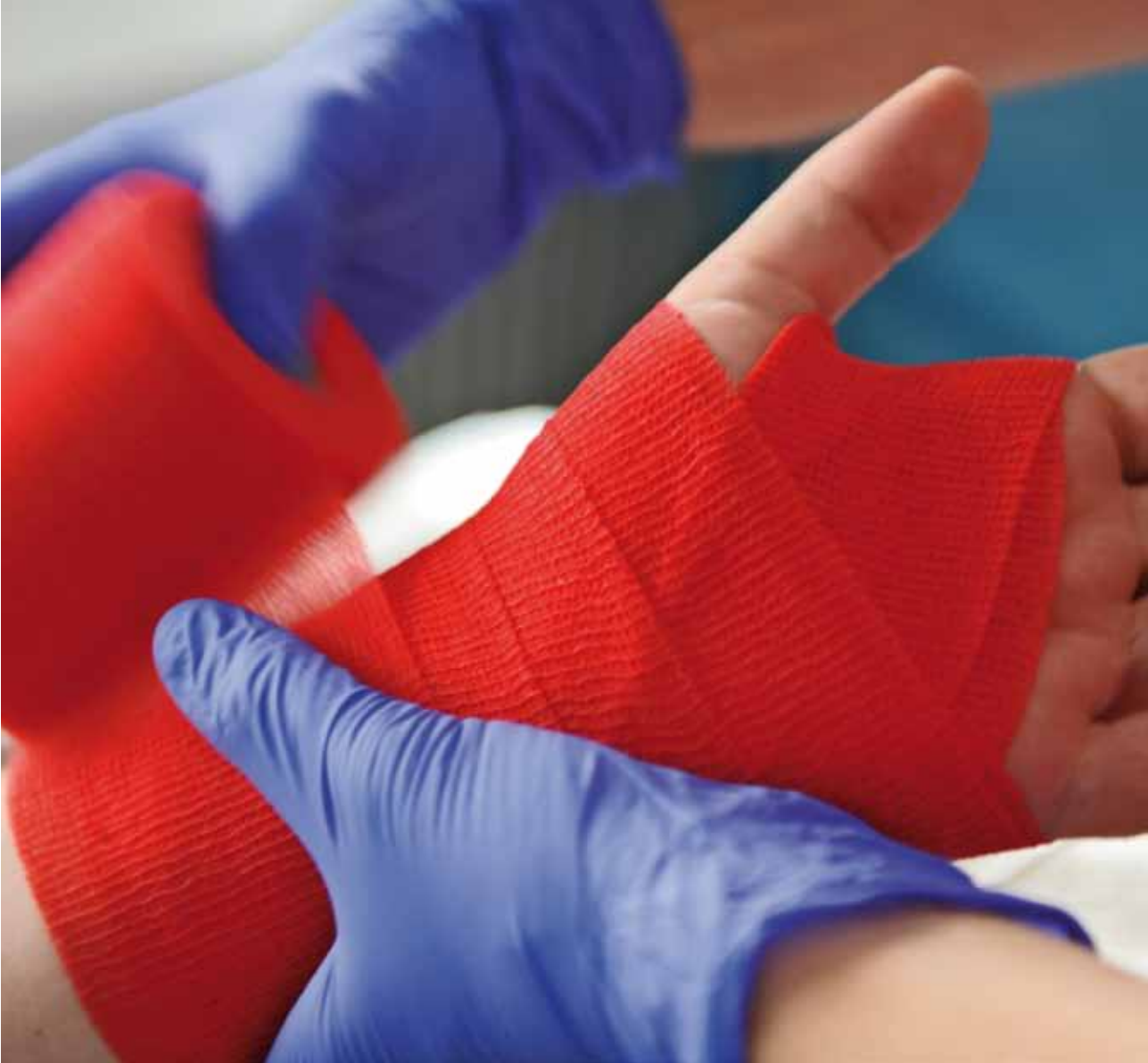
Frakturversorgung in der Ambulanz